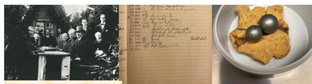
Mysterium 1 – Möte i mystisk trähydda i skogen