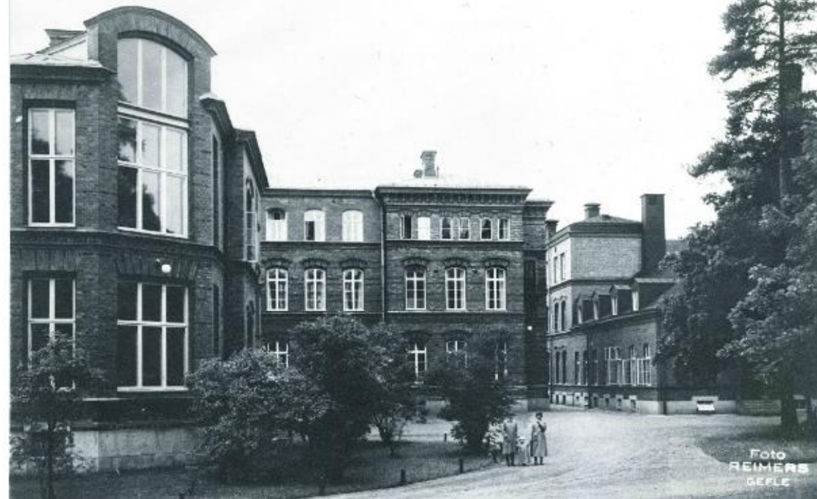
Gefle lasarettområde.